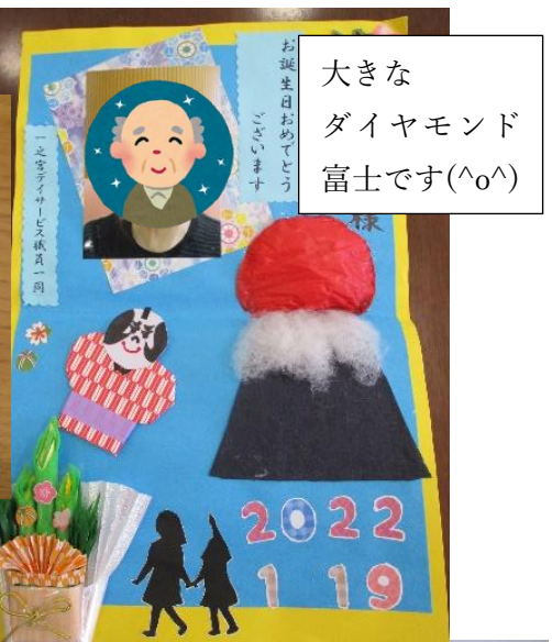
大きなダイヤモンド富士です(^o^)