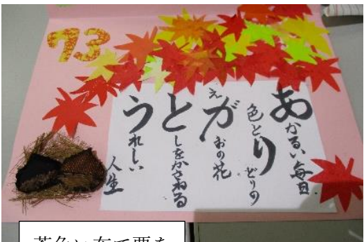
茶色い布で栗を作っています